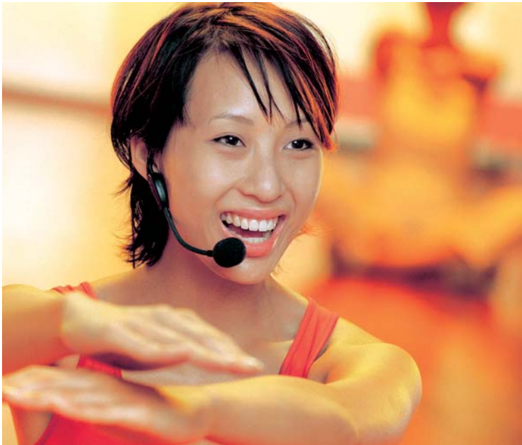
Drahtlose Mikrofone unverzichtbar

Mit der Digitalisierung von Rundfunk und Fernsehen werden Sendefrequenzen neu verteilt. Dabei droht den Funkmikrofonen, als Verlierer auf der Strecke zu bleiben.